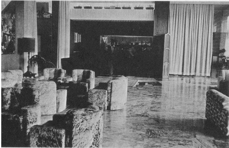
De vastes salons au confort raffiné.