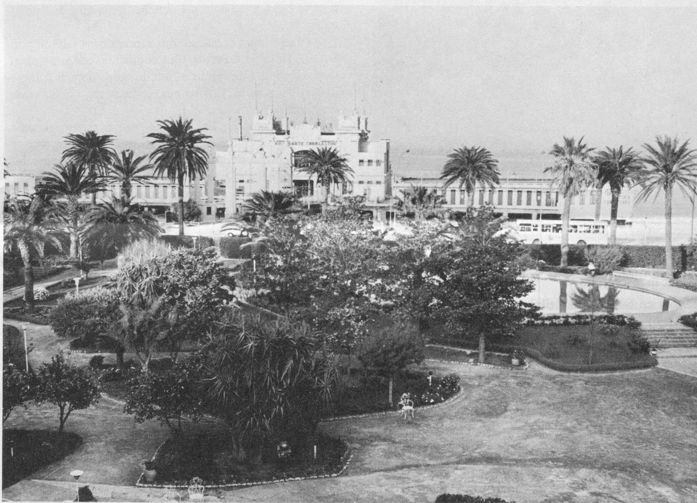
Le Mondello Palace possède un grand parc avec piscine.

Amis lecteurs, lisez attentivement nos programmes et, votre choix fait, inscrivez-vous dès que possible, afin d'éviter la liste d'attente!