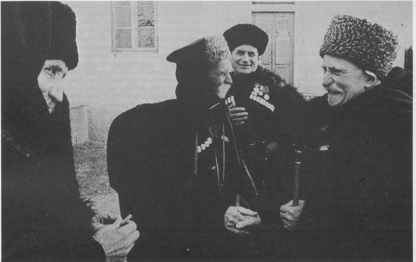
Les centenaires du Caucase vous accueilleront.

rencontre avec les centenaires; toutes les excursions à Moscou, la pension complète (3 repas par jour), le logement en chambres à 2 lits, la soirée théâtrale à Moscou, les services d'un guide parlant français, les taxes d'aéroport, les porteurs, les assurances pour perte ou vol de bagages pour Fr. 2000.—, les assurances pour frais d'annulation ou de retour prématuré en cas de nécessité. Quelques excursions supplémentaires à départ de Sotchi sont possibles (non comprises dans le prix): visite de Sotchi Fr. 15.—; excursion au mont Akhoun Fr. 15.—; visite du bois d'If Fr. 15.—; excursion au lac Ritza Fr. 46.—, soirée au Restaurant «Aoul du Caucase» avec repas (spécialités géorgiennes) Fr. 46.—.