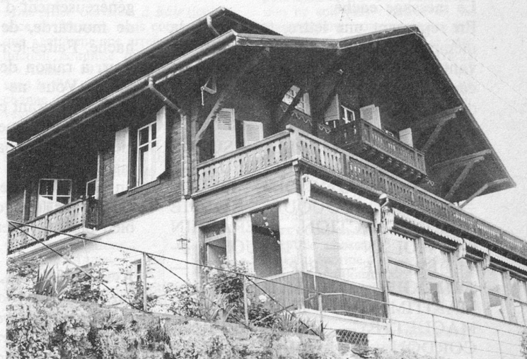
L'Hôtel de la Toison d'Or à Gryon. Un grand chalet confortable au soleil...

Ces prix pour la pension complète, ne comprennent pas le voyage. Le nombre de places disponibles étant limité, il est conseillé aux personnes que cette offre intéresse de s'annoncer dès que possible en demandant un bulletin d'inscription aux Secrétariats cantonaux de Pro Senectute. Les adresses de ces secrétariats figurent en tête de la page 15 de ce numéro.