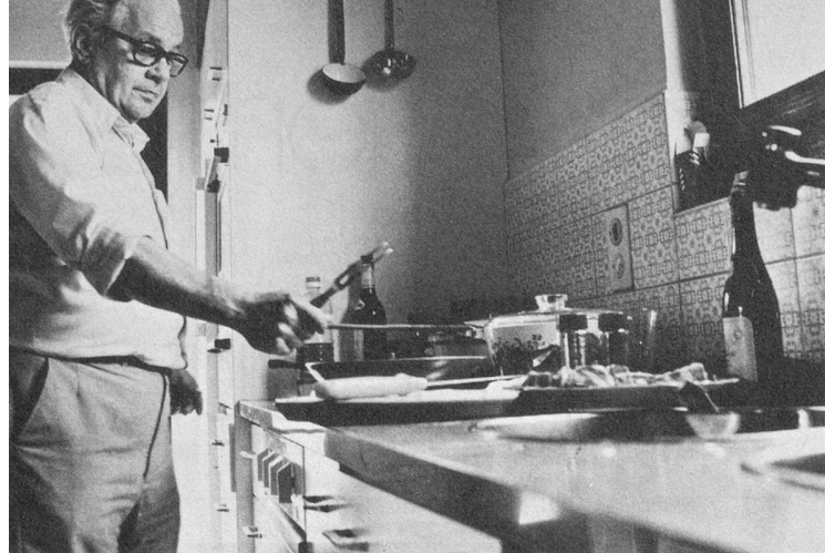
L'artiste au travail.

d'hui commencent à en avoir ras le bol des sauces toutes faites, des tubes, des potions de toutes sortes qui ne sont que des ersatz.