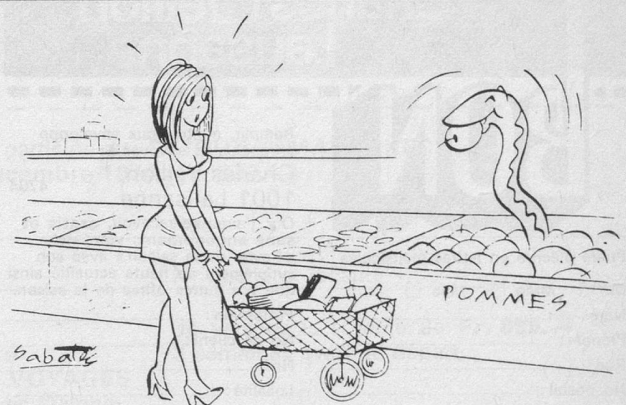
Histoire sans paroles.

Pour tous renseignements et visite s'adresser à: GÉRANCE DES IMMEUBLES DUBIED rue du Musée 1, 2001 Neuchâtel - tél. 038 25 75 22, interne 81