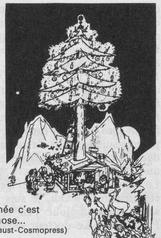
Chaque année c'est la même chose... (Dessin de Faust-Cosmopress)

Piquez une orange de clous de girofle. Ce hérisson amusant embaume toute l'année et même plus longtemps. Attention ! Faites vos hérissons à l'avance : certaines oranges pourrissent au lieu de sécher.