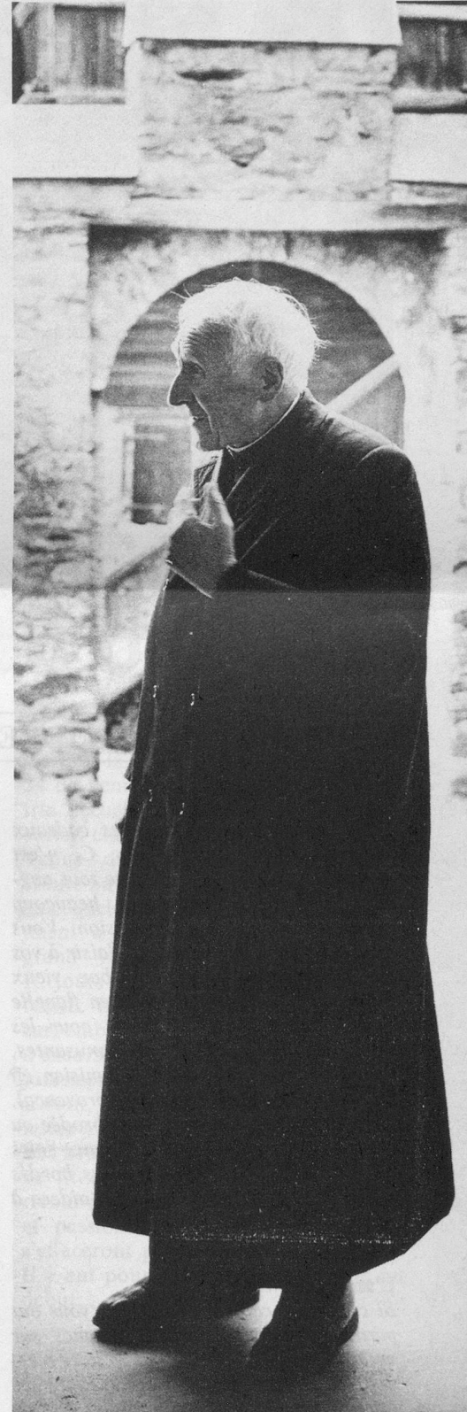
Un géant de 89 ans, droit comme un i.