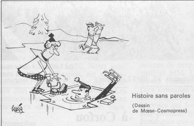
Histoire sans paroles