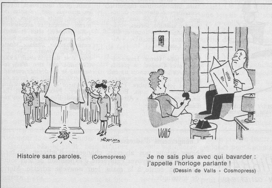
Histoire sans paroles.

Nous prions nos abonnés de bien vouloir ne pas renouveler leur abonnement annuel avant d'avoir reçu le bulletin de notre administration. Merci ! Aînés.