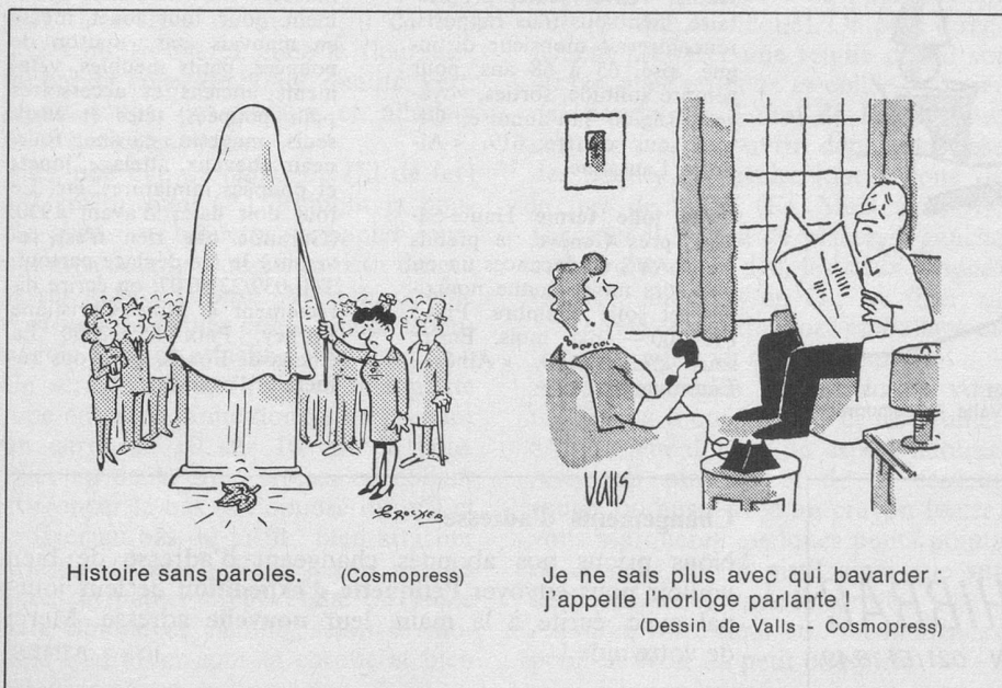
Histoire sans paroles.

Nous prions nos abonnés de bien vouloir ne pas renouveler leur abonnement annuel avant d'avoir reçu le bulletin de notre administration. Merci! Aînés.