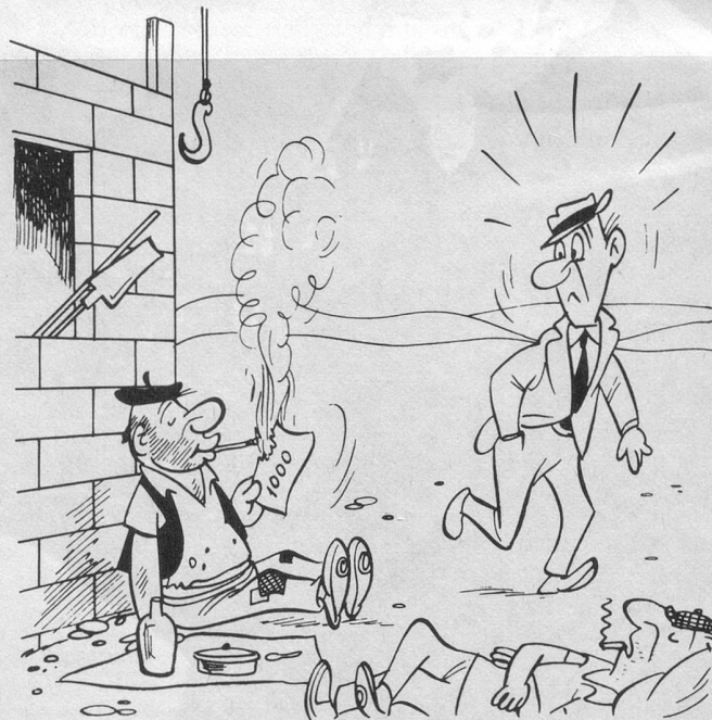
Sans paroles (Dessin de Sabatès).