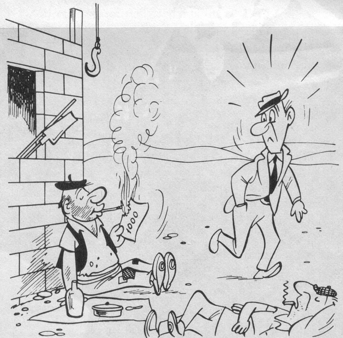
Sans paroles (Dessin de Sabatès).