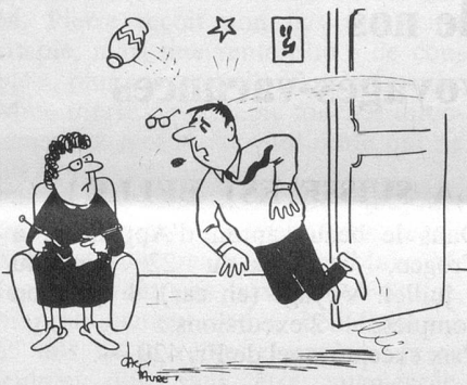
Et voilà... J'ai pas mis cinq minutes pour endormir le gosse. (Dessin de Faure-Cosmopress)

Ajoutons que Mme Jan pratique l'animation théâtrale également avec des enfants et des adultes. En ce moment, ce sont 9 jardinières d'enfants de la ville qui suivent son cours.