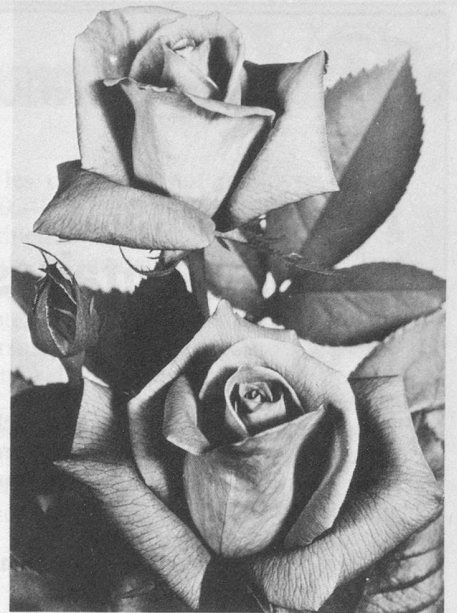
La nouvelle « Rose Mirafiori ».

Ancien hôtelier zurichois, il passe aujourd'hui pour le pionnier mondial de