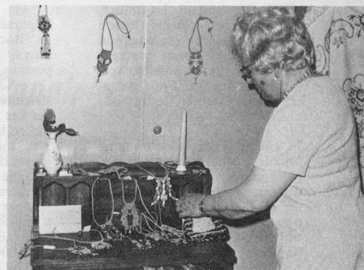
Vue, très partielle, des objets exposés.