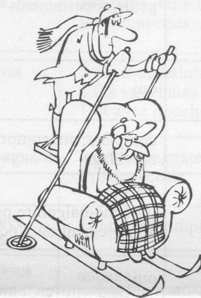
— Sans paroles. (Dessin de Moese-Cosmopress)

Il fait partie de toute chau- [mine. Dans la joie comme dans le [malheur. Et, de sa présence il l'illumine.