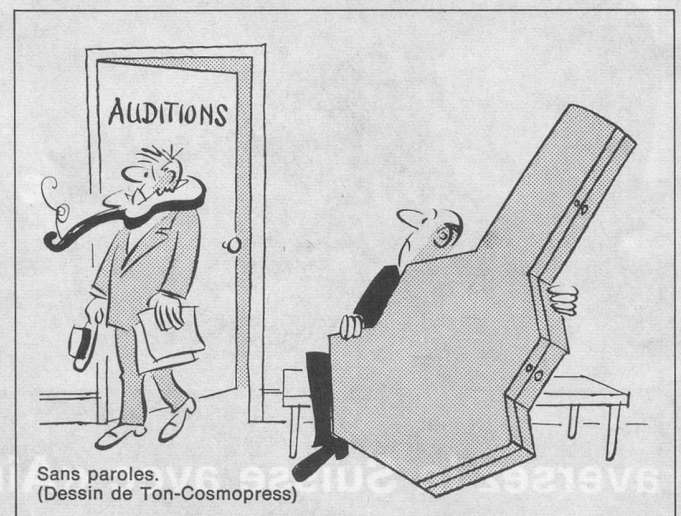
Sans paroles.