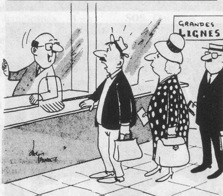
— Mais, bien sûr !... Il y a un tarif moins cher qu'en deuxième classe... mais pour cela il vous faut une muselière !... (Dessin de Faure - Cosmopress)

Elles auront lieu du mardi 19 au vendredi 29 octobre 1976 à l'Hôtel Luna, à Ascona. Pour tous renseignements, veuillez vous adresser au bureau cantonal, rue Saint-Pierre 26, 1er étage, 1700 Fribourg, tél. (037) 22 41 53.