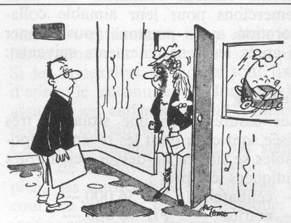
— Devine ce qui est arrivé au réverbère au coin de la rue ? (Dessin de Faure - Cosmopress)