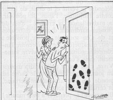
— Notre voisin est venu hier soir rouspéter pendant notre petite fête ! (Dessin de Sabatès.)

Réponse. Les règles et usages locatifs du canton de Vaud prévoient qu'il est interdit d'incommoder les voisins