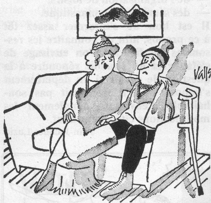
— Ça me rappelle notre voyage de nocces ; nous ne nous quitions pas d'une semelle ! (Dessin de Valls, Cosmopress)

Compte tenu des objectifs que nous nous sommes fixés visant à lutter contre les risques d'isolement de cer-