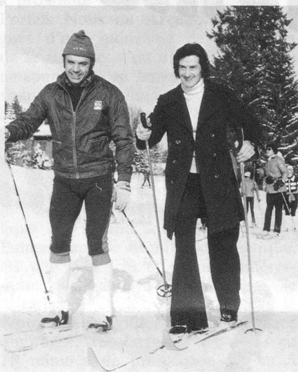
Elle a troqué ses skis alpins contre des skis de fond. Ça change !... La Madelon du ski suisse des années 50 est toujours en pleine forme.