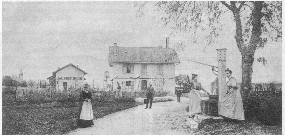
Collège de St-Bonnet, destiné aux communes de Bursinel et de Dully. En 1901, les maisons n'avaient pas encore l'eau courante. On s'approvisionnait au puits pourvu d'une pompe.

Aussi, désormais, nous prendrions la canne à pêche et, dans une boîte, une provision d'asticots et de vers de terre. Mais, hélas ! le temps était souvent à la bise : nous rentrions bredouilles et découragés.