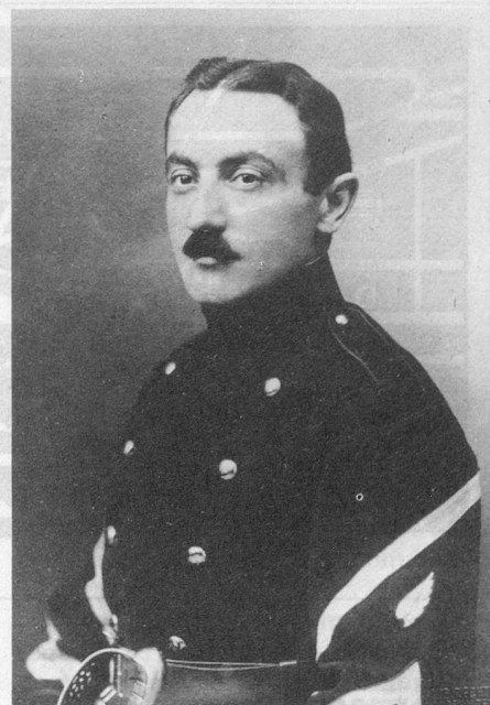
Agéonor Parmelin, aviateur, vainqueur du Mont-Blanc, né à Bursins le 8 janvier 1884, tué à Varèse (Italie) le 28 avril 1917 au cours d'un vol d'essai.

Pourtant, les journaux parlaient quelquefois des exploits accomplis par des hommes qui, à l'étranger et même en Suisse, avaient grimpé haut dans le ciel et parcouru de grandes distances. On apprit même, un jour, que l'aviateur Agéonor Parmelin, un « Genevois », parti du bout du lac, avait passé par-dessus le Mont-Blanc à 5540 mètres d'altitude pour aller atterrir à Aoste, en Italie, le 11 février 1914. Les journaux parlèrent avec enthousiasme de cette performance. Or, tous les Parmelin, quel que soit leur domicile, sont originaires de Bursins et l'on se souvint qu'Agéonor y était né, qu'il y avait vécu sa première enfance et qu'il y avait de la parenté. Toute la population du village, instituteur en tête, voulut manifester sa joie et sa fierté. Pour bien montrer à ces « blagueurs de Genevois », et à tout le pays, que Parmelin était un Vaudois de Bursins, la Municipalité organisa une réception qui eut lieu un dimanche. On accrocha des drapeaux aux fenêtres, la jeunesse tressa des couronnes de mousse qu'on tendit à travers la rue principale. Musique en tête, bannière déployée, on fit en cortège le tour du village, avec collation devant la pinte du haut où des