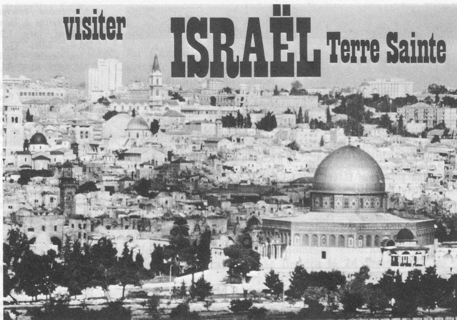
▲ Jérusalem. Au premier plan, la mosquée d'Omar.