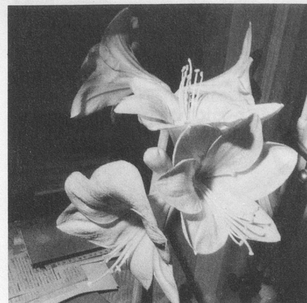
Une fleur, c'est déjà une présence...

Au vrai, elle ne savait pas à quoi ni à qui elle donnait son approbation. Elle agissait par instinct et parce que, à chaque fois, l'homme soupirait comme si, avec cet assentiment renouvelé, son désespoir se fût liquéfié, dissous dans sa respiration.