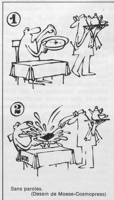
Sans paroles. (Dessin de Moese-Cosmopress)