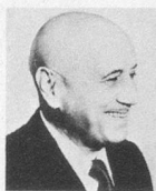
par Jean Nohain

Je viens de rendre visite pour vous, chers aînés, à une de nos plus vieilles amies de Paris: je suis allé faire trois petits tours sur la Tour Eiffel.