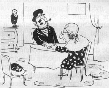
— Je vois des voyages pour vous... Vous prendrez le bateau... (Dessin de Faure - Cosmopress)