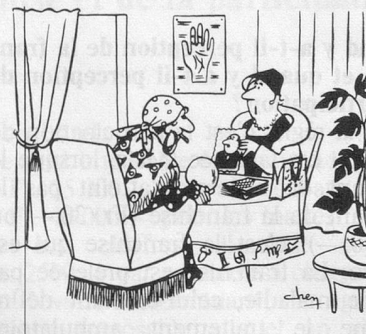
— On va se marier. Parlez-moi de son passé, je me charge de son avenir! (Dessin de Chen - Cosmopress)