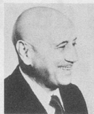
par Jean Nohain