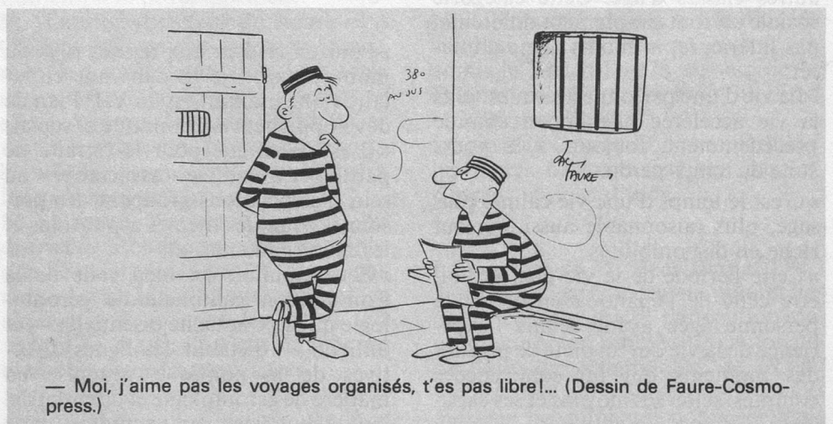
— Moi, j'aime pas les voyages organisés, t'es pas libre!... (Dessin de Faure-Cosmo-press.)

Toute personne qui rend visite à Pro Senectute est bien reçue. Mais si elle a