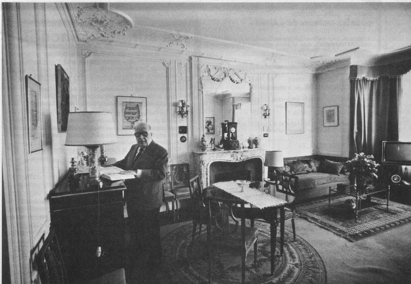
Le dictionnaire, compagnon inséparable du «mots-croïste».

Dans le prochain numéro: «Rose de Pinsec».