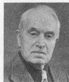
par André Chabloz