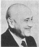
par Jean Nohain