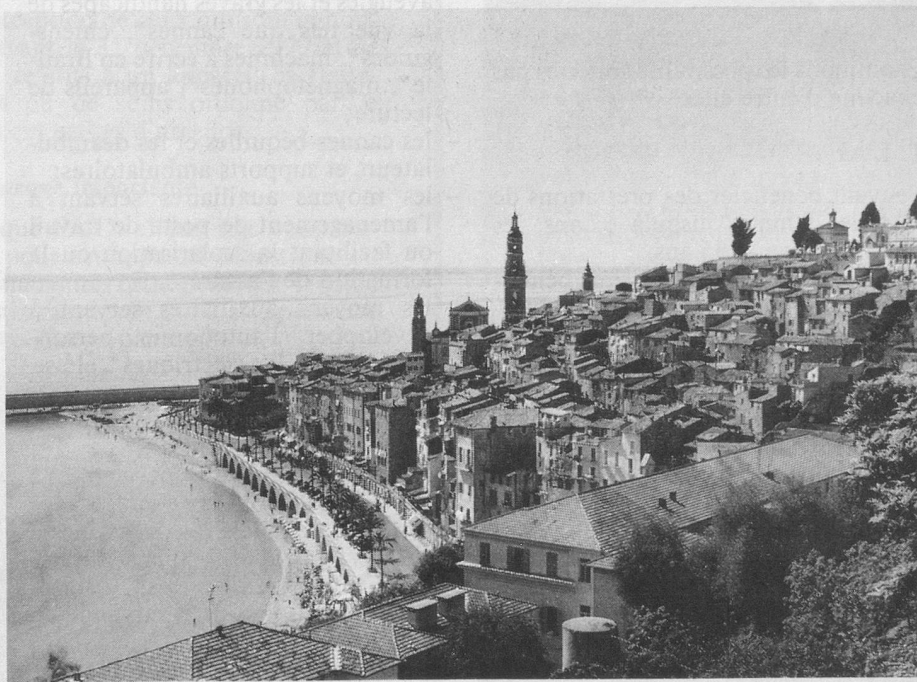
Menton, vieille ville et église Saint-Michel.

Départ de Monthey à 6 h. 30. Le car accueille au passage les voyageurs de Aigle, Montreux, Vevey, Lausanne et Genève. Papiers d'identité nécessaires.