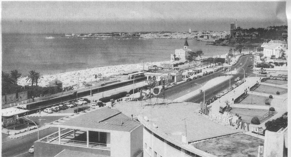
Vue partielle d'Estoril et de ses plages.