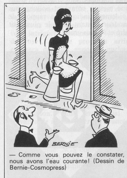
— Comme vous pouvez le constater, nous avons l'eau courante! (Dessin de Bernié-Cosmopress)

Pro Senectute et la Croix-Rouge se réjouissent d'accueillir chaque nouveau volontaire.