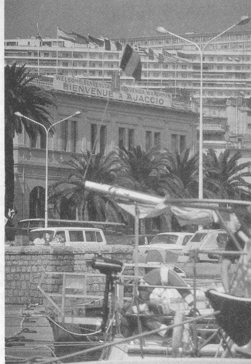
Dans le port d'Ajaccio.

— Moi, ça ne tourne pas rond aujourd'hui! (Dessin de Hervé-Cosmopress.)