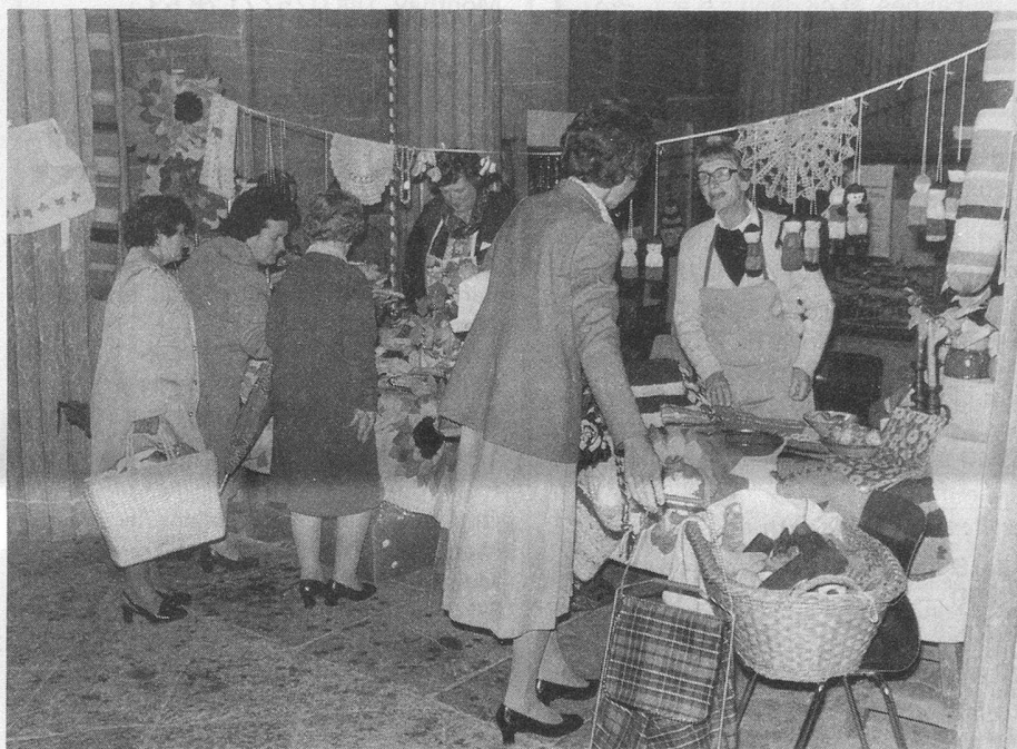
Des stands dans les rues. Un air de fête.

sa satisfaction: « La journée du 60 e anniversaire de notre institution fut une grande manifestation de solidarité. De tout le canton les retraités ont collaboré à la réussite de cette fête. Mais il reste encore du travail pour chacun. Ceux et celles qui désirent mettre leurs dons au service de la collectivité (activités sportives, clubs de loisirs, clubs de midi, visite aux isolés, transports) seront les bienvenus! Les travailleurs sociaux de nos secrétariats se feront un plaisir de renseigner toutes les personnes intéressées. Encore merci à chacun, et en route pour une nouvelle étape! »