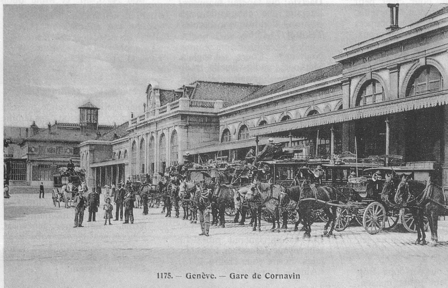
1175. — Genève. — Gare de Cornavin

Au début du siècle, Genève n'avait pas encore la vocation de siège d'institutions internationales. Par contre, le tourisme y était particulièrement développé. En grande tenue et galonné à souhait, un gendarme surveille les calèches des hôtels qui attendent le client, tout comme les taxis dont le carburant était l'avoine. Au fond arrive une diligence, qui doit être celle du Pays de Gex.