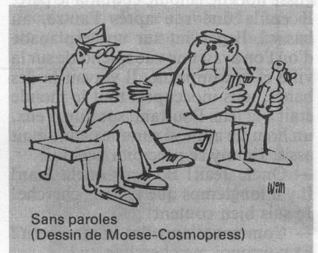
Sans paroles (Dessin de Moese-Cosmopress)

— 1 an pour les assurés de condition modeste; et