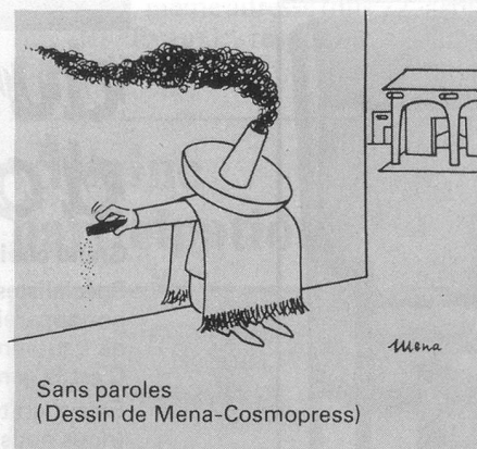
Sans paroles (Dessin de Mena-Cosmopress)

L'assurance avait un caractère facultatif. Il n'y a donc pas d'assurance obligatoire pour les personnes âgées dans le canton du Valais.