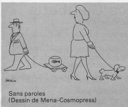
Sans paroles (Dessin de Mena-Cosmopress)

La possibilité d'adhésion à une caisse n'a été offerte que du 1 er janvier au 31 décembre 1974. Actuellement, les personnes âgées de plus de 60 ans ne peuvent donc plus s'affilier, sauf si les statuts de l'une ou l'autre caisse fixent l'âge limite d'admission au-delà de 60 ans. Pour savoir quelles sont ces caisses, prière de s'adresser à la Fédération genevoise des caisses maladie, Place du Cirque 1 bis, tél. 022/21 22 97.