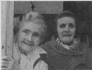
« Les Madivonnas » de Vogüé