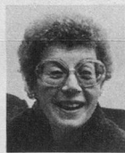
D'une génération l'autre, de Sophie à Geneviève