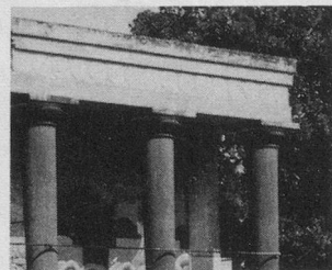
Avec « Aïnés », séjour printanier en Grèce (30 avril au 11 mai 1980)