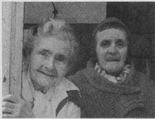
« Les Madivonnes » de Vogüé