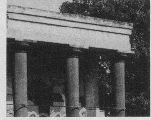
Avec « Ainés », séjour printanier en Grèce (30 avril au 11 mai 1980)