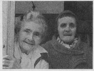
« Les Madivonnes » de Vogüé