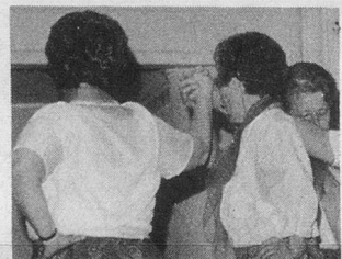
15 ans de gym 3 dans le canton de Vaud