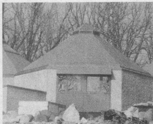
Le village de vacances de Douanne