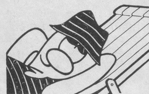
Séjours pour rhumatisants