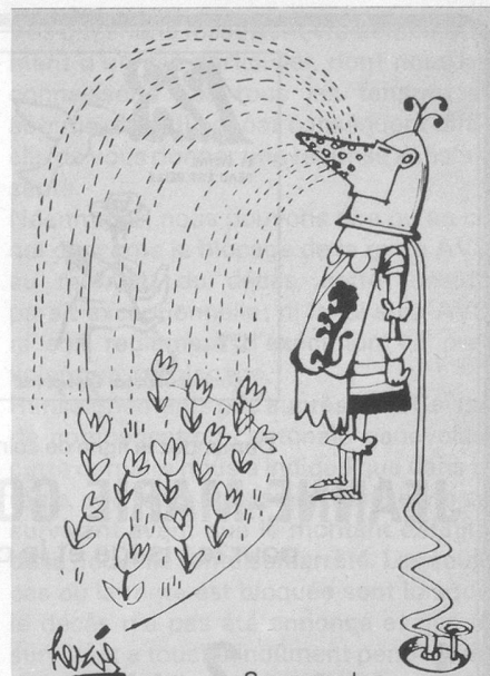
Sans paroles (Dessin de Hervé-Cosmopress)