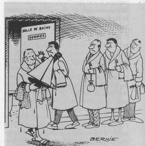
Sans paroles (Dessin de Bernie-Cosmopress)

Les personnes âgées non soumises à l'obligation d'assurance (celles qui ont un revenu plus élevé que les précitées) ne peuvent s'assurer que si elles en font la demande: