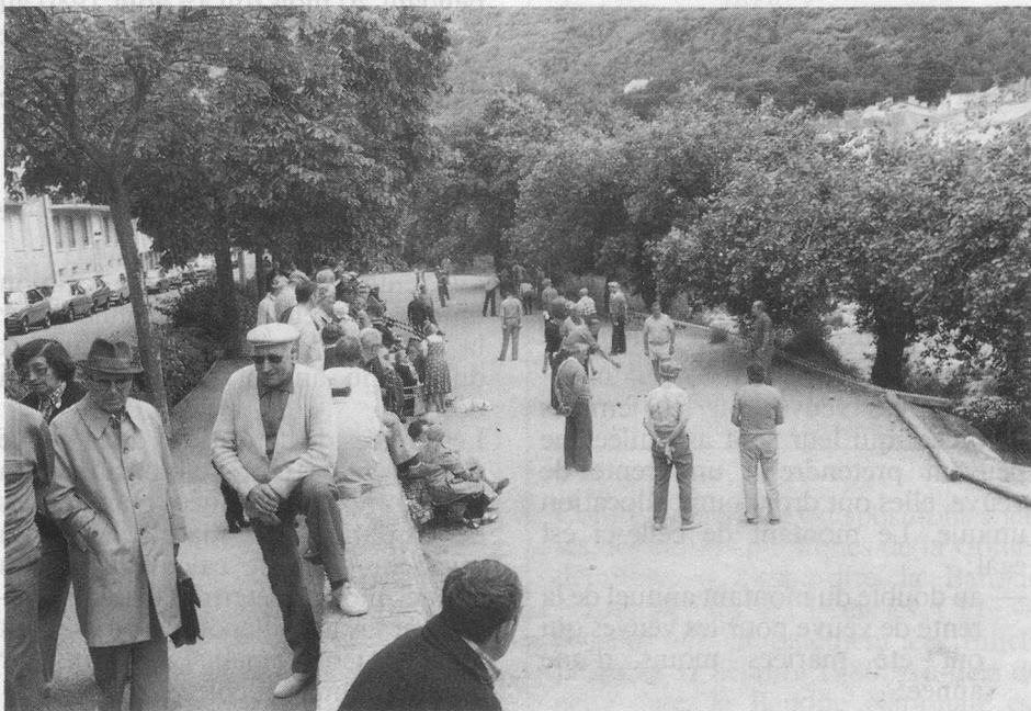
Au bord du Tech, chaque jour, la pétanque...

Je m'acquitterai du montant de la facture qui me sera envoyée avec un bulletin de versement, au moins 3 semaines avant le jour du départ.