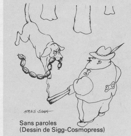
Sans paroles (Dessin de Sigg-Cosmopress)

spectaculaire. Mais combien d'entre nous auraient imaginé une caille se levant le matin en bâillant (sic), se rendant aussitôt à la salle de bains pour y déposer ses besoins sur un kleenex (re-sic) puis sautant sur la table de la salle à manger pour y boire son jus d'orange et y picorer son toast beurré (re-re-sic)? Enfin, grondant la ménagère négligente qui n'a pas bien remis fauteuils et tapis en place (sic et re-re-sic), avouons que c'est amusant. Et plus qu'amusant, touchant. Des plus familiers aux plus sauvages, les animaux sont prêts à nous donner leur confiance. La méritons-nous?