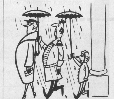
Sans paroles (Dessin de Raynaud-Cosmopress)