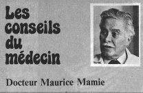
Docteur Maurice Mamié

première phase, prodromale, de constriction vasculaire, suivie dans un deuxième temps d'une intense vasodilatation des artères intra et extracranéennes, qui, elle, correspond à la partie douloureuse de la migraine. A ce mécanisme vaso-moteur participent des substances chimiques actives qui, entre autres, ont pour effet d'abaisser le seuil de la douleur. La symptomatologie est caractérisée par l'apparition de douleurs sourdes ou pulsantes, diffuses ou unilatérales, parfois temporales, survenant le matin ou en cours de journée, s'intensifiant parfois jusqu'à devenir intolérables. Ce syndrome douloureux est souvent complété par des phénomènes associés tels que l'intolérance aux bruits et à la lumière, ce qui oblige souvent le migraineux à s'enfermer dans une chambre obscure et à s'allonger. Les nausées et les vomissements font partie intégrante de la crise migraineuse. Ils sont dus à l'orage neuro-végétatif qui caractérise celle-ci et qui se traduit au niveau hépato-biliaire par la production d'une bile très abondante et très foncée. Il serait erroné d'attribuer au foie la responsabilité de la migraine, comme cela est malheureusement trop souvent le cas. De toute façon un