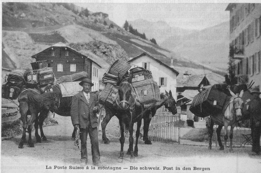
La Poste Suisse à la montagne — Die Schweiz. Post in den Bergen