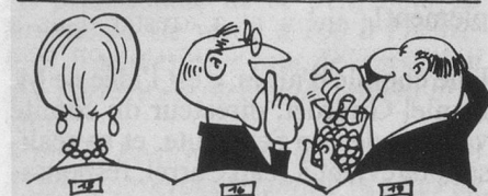
Sans paroles (Dessin de Moese-Cosmopress)