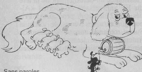
Sans paroles