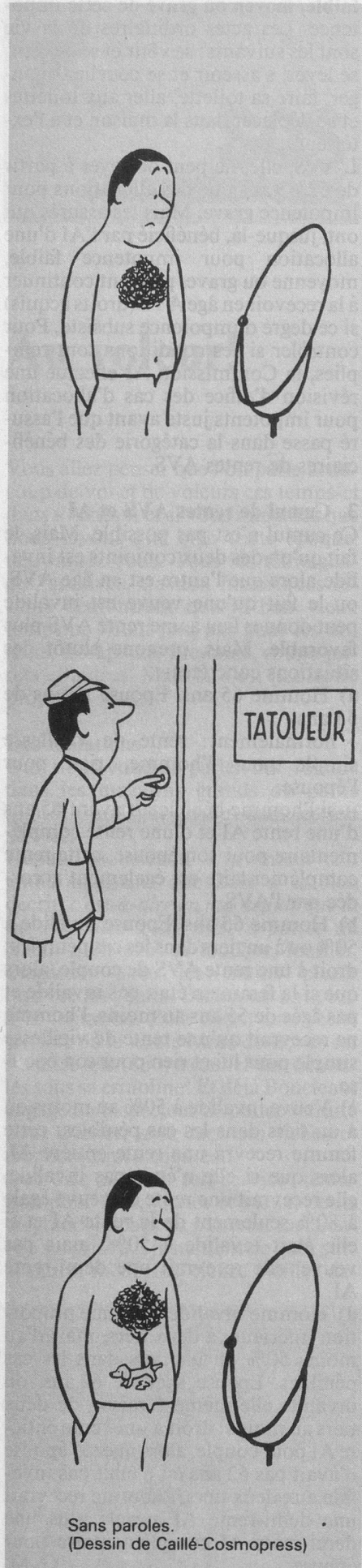
Sans paroles. (Dessin de Caillé-Cosmopress)

A la suite de quel indice l'inspecteur Bazot a-t-il pu faire avouer Mary Mist? (Cosmopress).